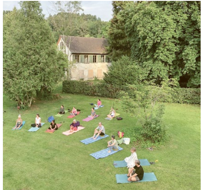
Der Park lässt sich beispielsweise für Yoga-Kurse gut nutzen.