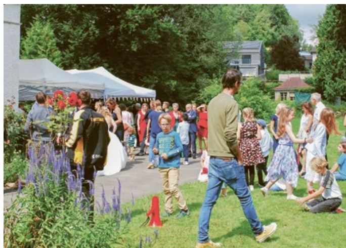
Ob Fest draussen...

Seit Anfang 2018 besteht der Verein Villa Spörri, der aktuell 40 Mitglieder zählt. Er mietet die Villa von der Gemeinde Hittnau als sogenannte Zwischennutzung, bis die künftige Funktion des Gebäudes im Zusammenhang mit dem Projekt Alterswohnen Luppmenpark geklärt ist.