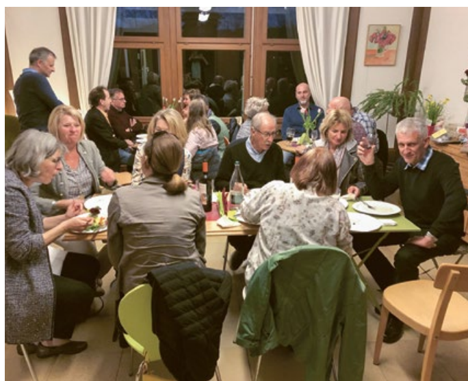
... oder drinnen: Die Villa Spörri bietet ein passendes Ambiente für Anlässe vieler Art.